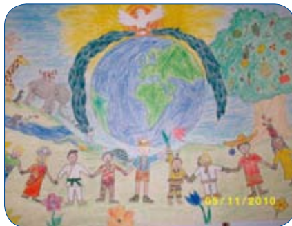
1. Preis Emelie Jacobs Gym Schwarzenbek

Rund 800 Schülerinnen und Schüler haben allein in unserem Distrikt am diesjährigen Wettbewerb teilgenommen - ein Rekord! Mit ihren kunstvollen Malergebnissen haben sie ein Zeichen für den Frieden ge-