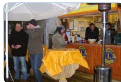
"Frostschutz" bei eisigem Dezemberwetter

Der Lions Club Segeberg wurde am 30. Januar 1961 gegründet und befindet