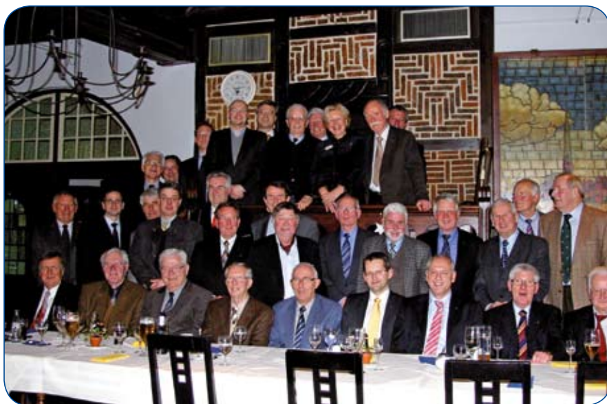
Traditionelles Dreikönigstreffen im "Ratskeller Krempe" mit den LCs Glückstadt und Itzehoe

Draußen eisig, drinnen im betagten Kremper Rathaus anheimelnd warm und gemütlich, dazu das traditionelle Dreikönigsessen, das so bereits seit 34 Jahren serviert wird: Sauerfleisch, Roastbeef, Rippchen, dazu deftige Bratkartoffeln. Ein zünftiges Bier durfte dabei nicht fehlen und – im Nu waren alle aufgewärmt und in guter Stimmung. Der „Königs“-Abend