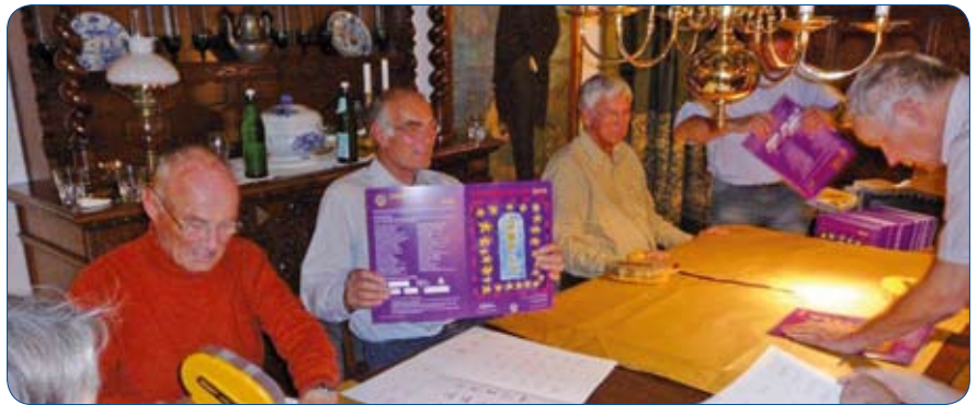
Hier wird eifrig gefalzt, geklebt, gestapelt

Die Adventskalender der beiden Husumer Lions Clubs zeichnen sich stets durch künstlerisch anspruchsvolle Motive aus. Darum sind sie für viele Käufer zum begehrten Sammlerobjekt avanciert. Die Kalender landen dann am Weihnachtstag nicht im Altpapier-Container, sondern finden einen Eh-