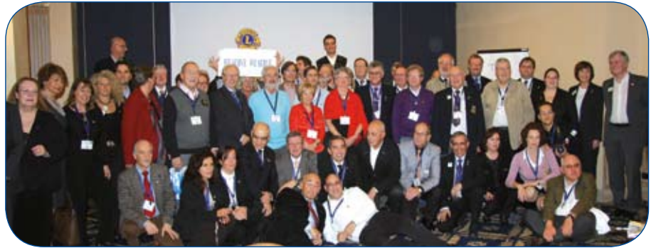
Senior Lions Leadership Institute in Bologna: Abschiedsfoto mit allen „Schülern und Lehrern“.