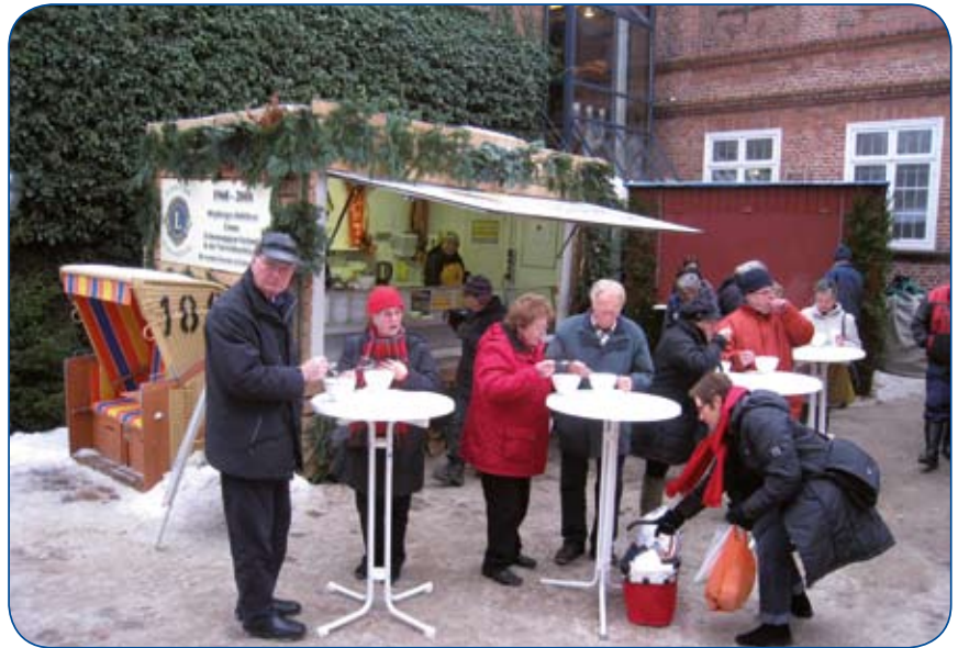
Lions Verkaufsstand des LC Eckernförde inmitten winterlicher Umgebung .

Im vergangenen Jahr startete unsere Aktion „Erbsensuppe“ am 26. November. Der Verkaufsstand war täglich