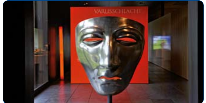
Reitermaske - Varus Schlacht

Für Ihre Partnerin / Ihren Partner gibt es daneben ein interessantes Begleitprogramm wie beispielsweise den Besuch des Museum der Varus-Schlacht und des Osnabrücker Schlosses, eine Stadtführung, einen Rundgang durch Bad Essen, einen Ausflug zum Schloss Hünnefeld und vieles mehr. Das Rahmenprogramm bietet vielfältige Veranstaltungen für jeden Geschmack. Da die Teilnehmerzahl begrenzt ist, bittet Osnabrück um frühzeitige Anmeldung, sodass man gegebenenfalls weitere Angebote arrangieren kann.