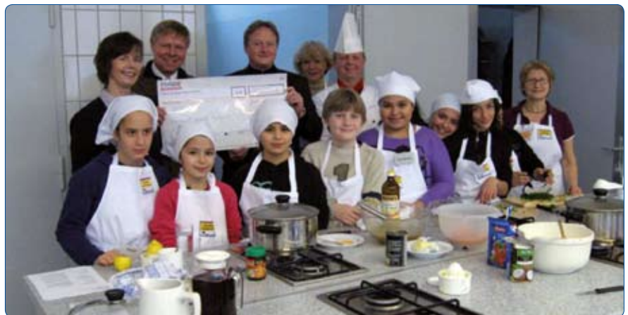
Das gesamte Team "Küche"