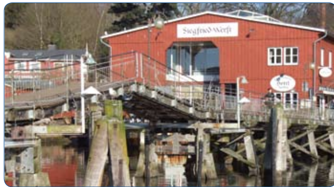
Die "Siegfried Werft" im Hafen

in der Stadthalle – findet dann am nächsten Tag, am Sonnabend, dem 2. April von 10 bis 16 Uhr die Distriktversammlung (DV) statt, mit die wichtigste Veranstaltung im Lionsjahr. Neben allen Berichten, Wahlen und Beschlüssen wird aber sicherlich noch genügend Zeit bleiben, um die ganz besondere Atmosphäre von Eckernförde zu schnuppern,