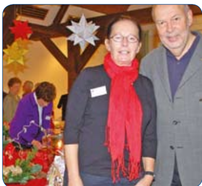
"Ein Besuch des Weihnachtsbasars hat sich für alle gelohnt"

Ein Besuch des 15. Weihnachtsbasars des Lions Clubs Kaltenkirchen lohnte sich. Dieser Basar hat bereits Tradition: Alle zwei Jahre organisieren die Partnerinnen der Löwen vom Lions Clubs Kaltenkirchen einen Weihnachtsbasar im Kaltenkirchener Bürgerhaus. Der Verkaufserlös kommt gemeinnützigen Förderzwecken zugute.