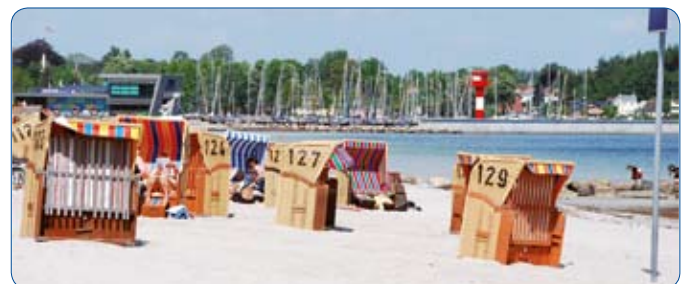
Strandleben in "Eckernföör"