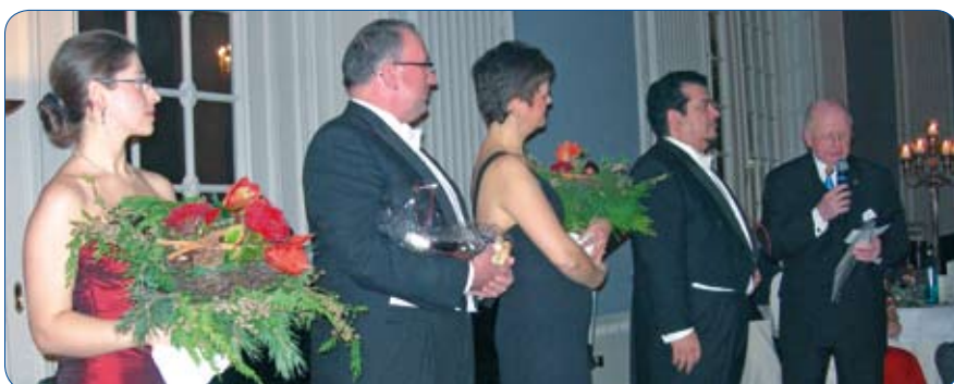
Schöne Stimmen, gute Stimmung - der Benefizabend war gelungen.

Nach dem wunderbaren Erfolg 2009 hat der LC Lübeck-Passat das 2. Christmas Belcanto veranstaltet. Das „Musikalische Menü“ fand wieder im historischen Ballsaal des Colum-