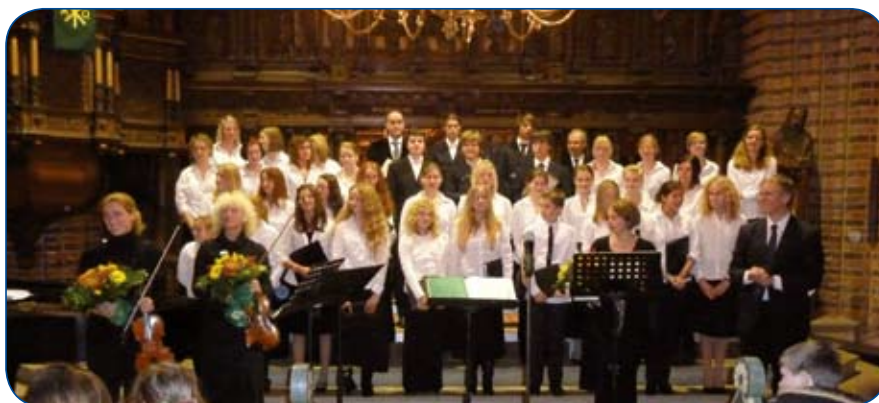
Die Jugendkantorei und Solistinnen des Streichorchesters freuen sich über den Applaus am Ende eines schönen Konzertabends.

Die Verbindung des LC Dithmarschen mit dem größten Jugendchor an der Westküste entstand vor 10 Jahren. Das gemeinsame Singen und das Vermitteln klassischer Musik als wichtiges Kulturgut stellt eine großartige und Persönlichkeit fördernde Form der Jugendarbeit dar. Die Begeisterung der jungen Künstler und ihren langjährigen Zusammenhalt zu erleben, ist für uns Lions stets wieder eine große Freude. Dem Chorleiter ist es gelungen, bereits über mehr als 20 Jahre ständig einen Chor von 30 – 40 Jugendlichen zu erhalten. Eine jährliche Studien- und Konzertreise ist der Höhepunkt der