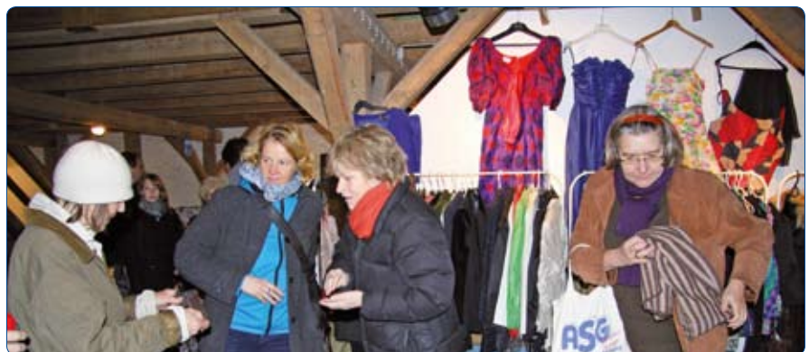
Von allem etwas und für jeden was - die Auswahl war wieder groß.

„First class – second hand“, so hieß es bereits zum sechsten Mal. Mit seinem großen Benefiz-Markt zog der Lions Club Eckernförder Bucht auch diesmal wieder zahlreiche Besucher und Käufer zum Gut Altenhof. Unter'm Dach der Konzertscheune gab es das gewohnt große und vielfältige Angebot: Kleidung, Bücher, Haushaltswaren, Kindersachen, Kunst und Kitsch warteten auf wohlwollende Käufer. Viele Helfer aus Eckernförde und Umgebung hatten großzügig gespendet, die veranstaltenden Lions dann alles gründlich durchsortiert, geordnet und auf Tischen wie an Garderobenständen übersichtlich präsentiert. Innerhalb weniger Stunden hatte das meis-