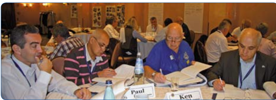
Schnell mal einen Vortrag vorbereiten - und das in Englisch!