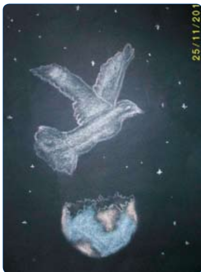
2. Preis Evindar Temel JPE-Realschule Winsen/Luhe

Wieder einmal hatte es die Jury nicht leicht, unter den vielen eingereichten, wunderbaren Werken die allerbesten herauszufinden und die Gewinner zu benennen. Auf den Fotos kann man die Siegerplakate bewundern.