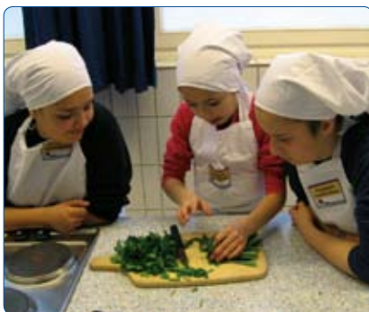
Kinder bei der Arbeit

HANS-JÜRGEN BÖCKEL, HAMBURG-BILLETAL *A279 WWW.LIONS-NORD.DE