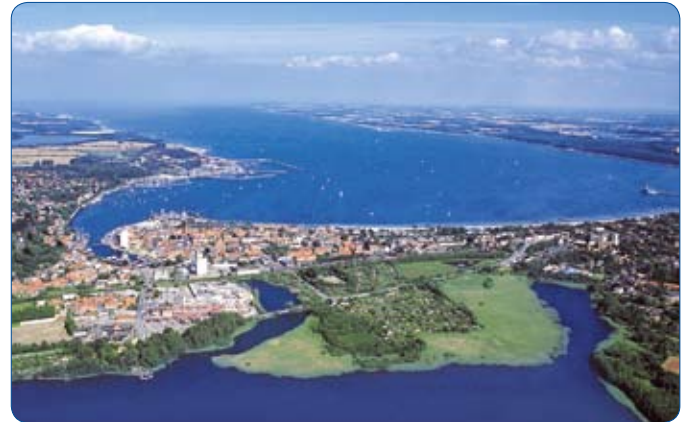
Eckernförde am Ostseestrand, Schauplatz der Distriktversammlung am 2. April 2011

Allein die Tatsache, dass die Stadthalle direkt an der Bucht liegt, ist schon einladend. Man kann leicht auf der Strandpromenade am Wasser entlang bummeln, ist in wenigen Minuten im authentischen Hafen, entdeckt dort romantisches Fisherman's-Flair mit Booten, Flaggen und „Emmas“. Nur wenige Schritte weiter, und man findet sich mitten im Fußgängergebiet wieder -