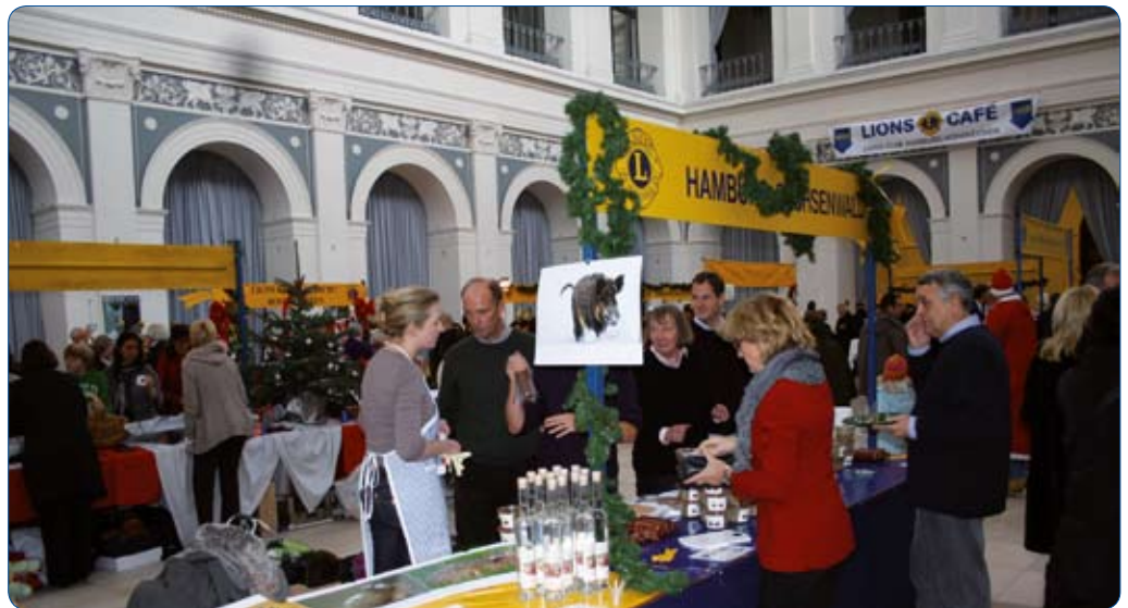
Lange Weile gab's nicht: An den Ständen herrschte reger Andrang

Hier gab es viele Geschenkideen für das Weihnachtsfest, Essen und Trinken für jeden Geschmack und vor allem jede Menge Spiel, Spaß und Unterhaltung. 150 Liter Erbsensuppe, 400 Würstchen, 150 Kilogramm Gebäck, 150 Kilogramm Wildsalami, 50 Kilogramm Wildleberterrine und 2.500 Schokoladenweihnachtsmänner fanden reißenden Absatz. Vorleser und Geschichtenerzähler unterhielten Eltern und Kinder, die für einen Moment ausspannen wollten, und das Gewinnspiel