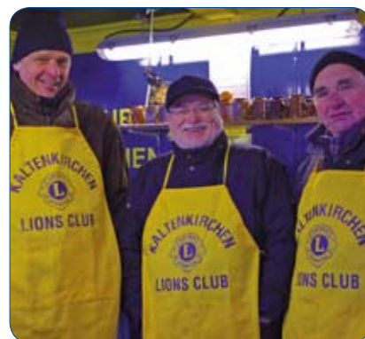
"Lions macht Freude - noch ein Punsch?"

HANS-GEORG BORCHERS LC KALTENKIRCHEN *A291 WWW.LIONS-NORD.DE