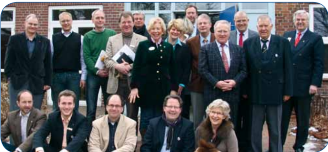
26. Februar in Leck