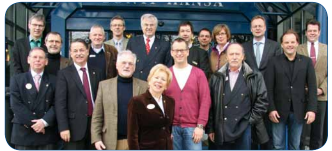
19. Februar in Kiel