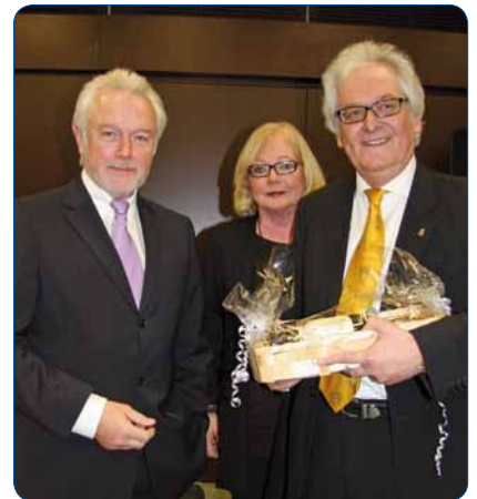
Ein informativer Clubabend - Wolfgang Kubicki, Angelika und Lutz König (v.li.)

Da wurde kaum ein politisch brisantes Thema ausgespart. Aufgaben, die 2011 in Land und Bund anstehen? Kubicki: „Eines kann ich Ihnen versprechen: Es bleibt spannend.“ Ob Haushaltskonsolidierung in Schleswig-Holstein, Rentensicherung, Abbau der Bundeswehr, die Bildungspolitik, das neue Wahlgesetz, – vieles kam zur Sprache. Nicht zuletzt hob Wolfgang Kubicki die Bedeutung des Ehrenamtes hervor: „Die Gestaltung des gesellschaftlichen Miteinanders ist keine alleinige Staatsaufgabe, sondern eine bürgerliche Verpflichtung.“ Darum habe es ihn auch besonders