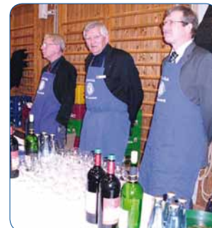
... in Erwartung der Gäste

Als Ergebnis des Benefizkonzertes konnten in Summe 6.000,- Euro zu jeweils gleichen Teilen an den Kinderschutzbund, die Bundespolizeistiftung und die Japanhilfe des Hilfswerkes der Deutschen Lions (HDL) überreicht werden. Durch ein zusätzliches En-