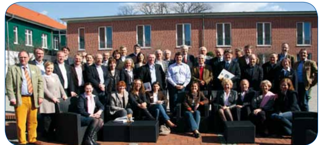
26. März in Hamburg

Wie in jedem der vergangenen Jahre kümmerte sich der Vize Governor um die Schulung der Vizepräsidenten, der Club-Sekretäre und -Schatzmeister.