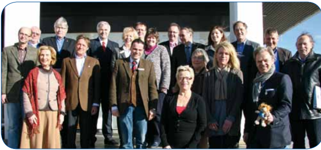
12. Februar in Travemünde