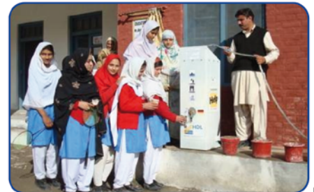
Mädchenschule Pakistan