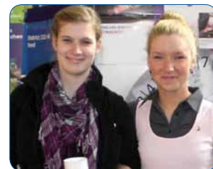
Mit Freude unterwegs für die gute Sache

Nicht nur finanziell war der LLSD für die N-Leos, sondern auch für die unterstützenden