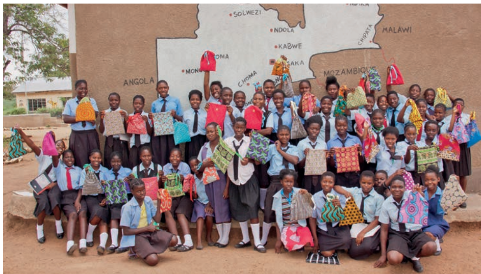
Kinder einer Schule aus dem Projekt in Ost-Zambia

Die Präsentation dieses Projektes führte uns wieder vor Augen, welche fundamentalen Bedingungen Bildung in einem afrikanischen Land wie Zambia einschränken bzw. verhindern. Auch das ehrenamtliche Engagement der Projektleiter vor Ort überzeugte uns und erreichte die Ohren und