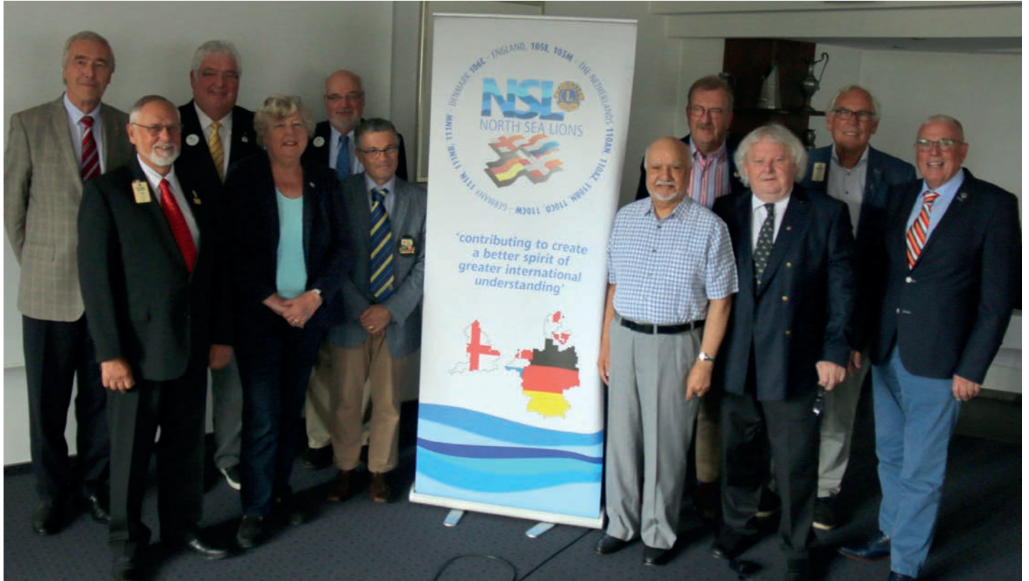
NSL-Deligierte in Lingen

Am 10.09.2017 trafen sich die NSL-Deligierte in Lingen an der Ems, um über ein neues Charity-Projekt zu beraten. Gastgeber war der District 111 NW.