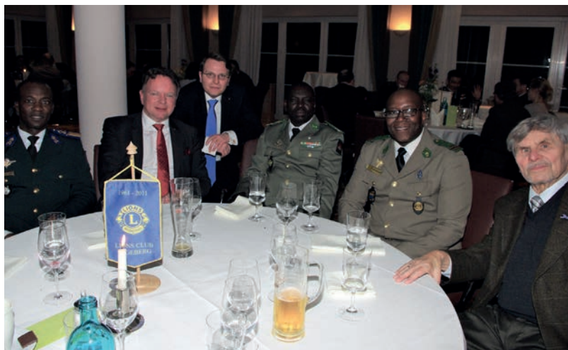
Internationaler Austausch und Zusammenarbeit, statt Abgrenzung: Lions und LGAI-Teilnehmer haben viele gemeinsame Schnittstellen

Bei einem Buffet wurden viele intensive und interessante Gespräche geführt, die für alle Seiten sehr bereichernd waren.