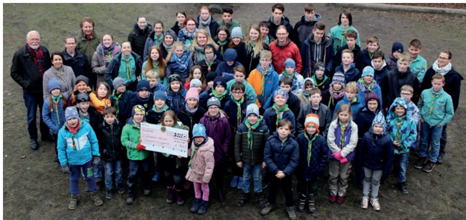
Kinder vom Gemeindepfadfinderstamm Halstenbek.

Neben dem spielerischen Erlernen der Pfadfindergesetze und dem sozialen Umgang miteinander kümmert sich der Stamm auch um ein Fledermaushabitat in Halstenbek. Die Kinder und