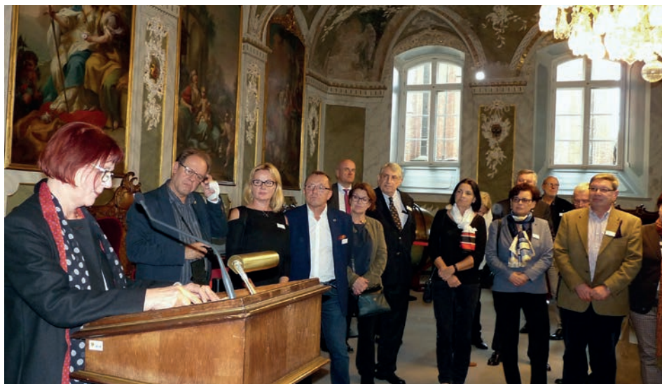
Vom Empfang im Audienzsaal des Lübecker Rathauses durch Stadtpräsidentin Schopenhauer zeigten sich die Gäste aus Danzig beeindruckt.

Es war der Auftakt zu einem Wochenende mit dicht gepacktem Programm. Dazu gehörte ein Besuch im Hansemuseum mit gemeinsamen Essen, ein Vormittag im „Museum Hansestadt Danzig“ mit Vortrag über das Günter-Grass-Haus und einem Musikprogramm polnischer