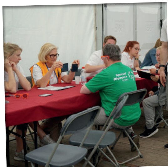
Ausgabe der Sonnenbrillen