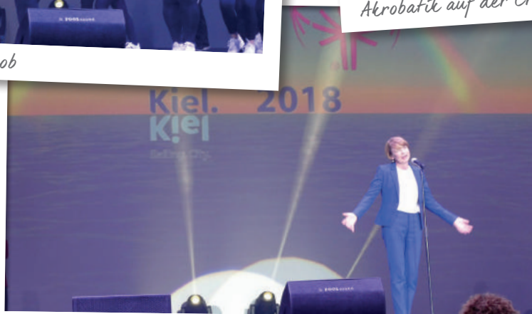
Elke Budenbender eröffnet die Spiele