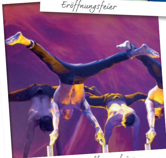
Akrobatik auf der Eröffnungsfeier