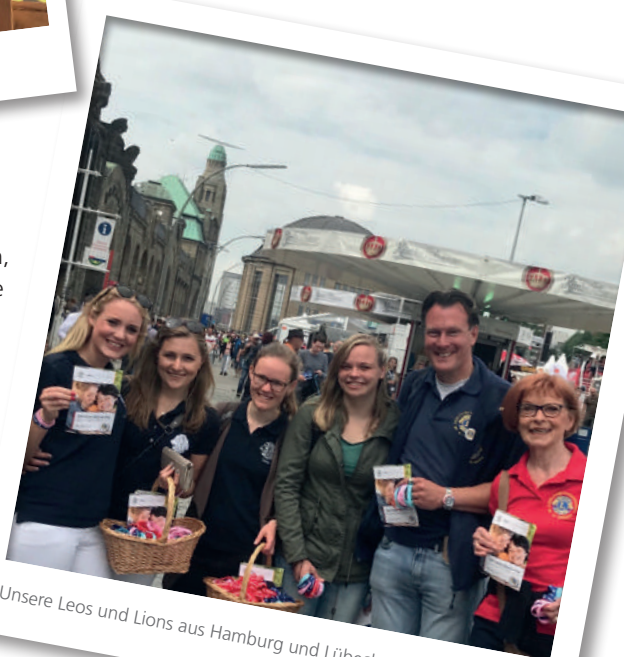
Unsere Leos und Lions aus Hamburg und Lübeck

An dieser Stelle nochmals ein riesiges Dankeschön an alle LEOs und Lions, die sich an dem Leo-Lions-Service-Day 2018 beteiligt haben, weite Anfahrtswege auf sich genommen haben und dazu beigetragen haben, Balu & DU zu unterstützen.