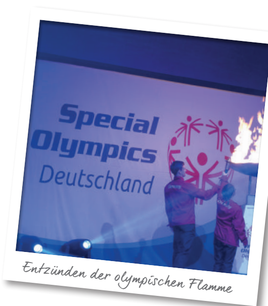
Entzünden der olympischen Flamme

Die 19 Sportarten der Special Olympics Kiel 2018 waren Badminton, Basketball, Beachvolleyball, Boccia, Bowling, Fußball, Golf, Handball, Judo, Kanu, Kraftdreikampf, Leichtathletik, Radfahren, Reiten (mit Voltigieren), Roller Skating, Schwimmen (mit Freiwasserschwim-