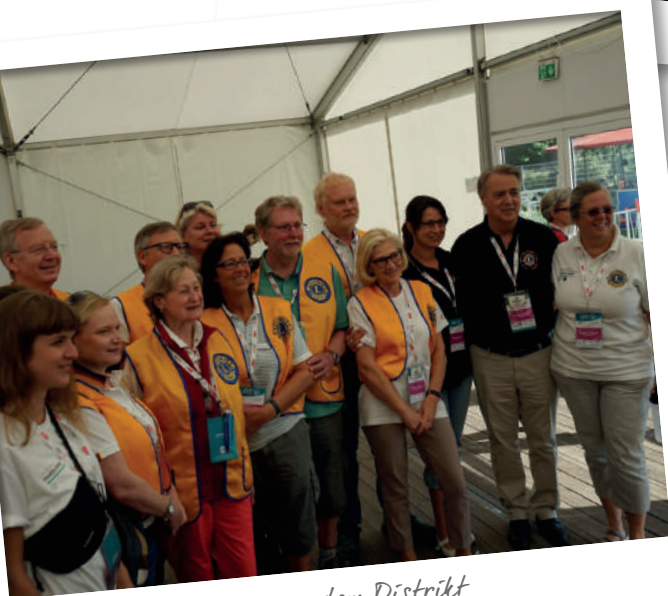
Lion Volunteers aus dem Distrikt