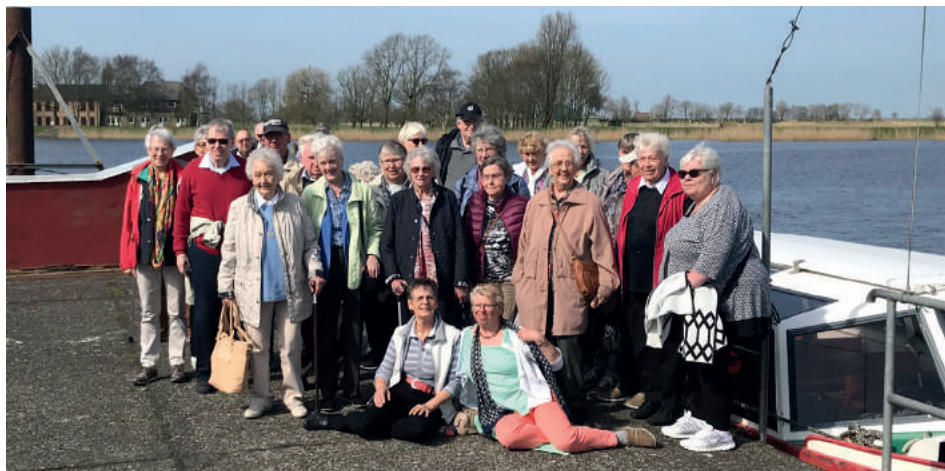
die Teilnehmer der Ausfahrt

Dann führte der Weg weiter nach Friedrichstadt mit seinem holländischen Grachtenflair. Dieses norddeutsche Kleinod ist am besten per Boot zu erkunden. Voller schöner Eindrücke von einem Ausflug bei traumhaftem Wetter