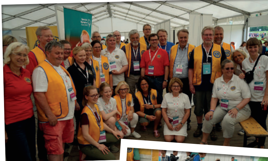
Lion Volunteers aus dem Distrikt

Am 14. Mai 2018 um 08:30 Uhr wurden die ersten Lions Volunteers zur Unterstützung des Gesundheitsprogramms Opening Eyes in ihre Aufgaben eingewiesen. Über 200 Athletinnen und Athleten wurden bereits an diesem Tag für die Augen-Untersuchungen registriert. Am Abend fand die offizielle, beeindruckende Eröffnungsfeier der Special Olympics Deutschland (SOD) in der Sparkassen-Arena in Kiel statt. >>