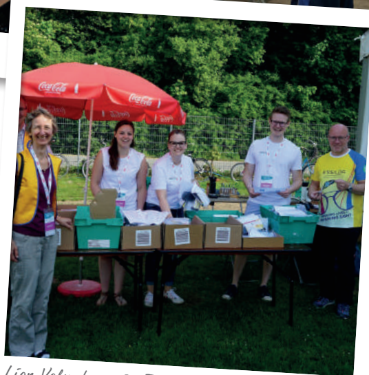
Lion Volunteers im Einsatz