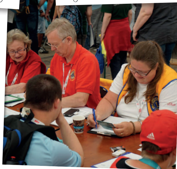
Unsere Volunteers beim Registrieren

Auch an den folgenden Tagen, bis einschließlich Donnerstag, 17. Mai 2018, hatten die Lions aus verschiedenen Lions Clubs des Distrikts 111 N alle Hände voll zu tun, um die Registrierung und weitere Betreuung aufgrund der hohen Nachfrage nach dem Gesundheitsprogramm zu meistern. Das Angebot für die Teilnahme an dem Gesundheitsprogramm Opening Eyes wurde insgesamt von 722 Athletinnen und Athleten gern und dankbar angenommen. Bei rund insgesamt 4.600 Teilnehmern an den Special Olympic Games ein beeindruckendes Ergebnis.