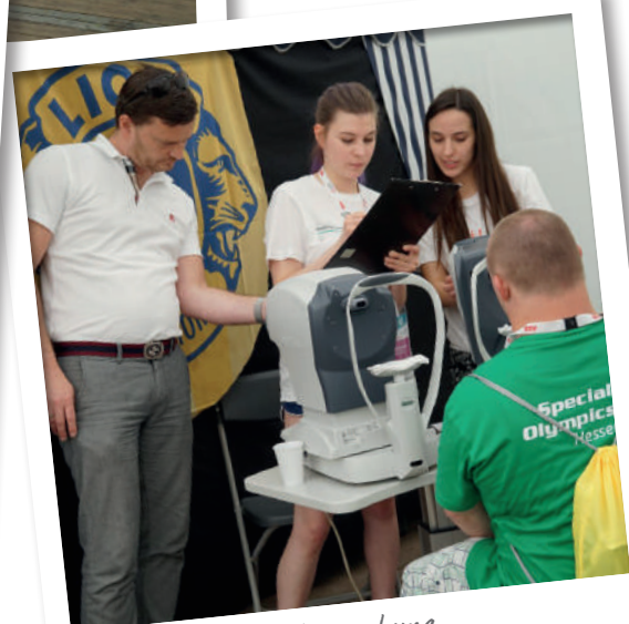
Bei der Augenuntersuchung