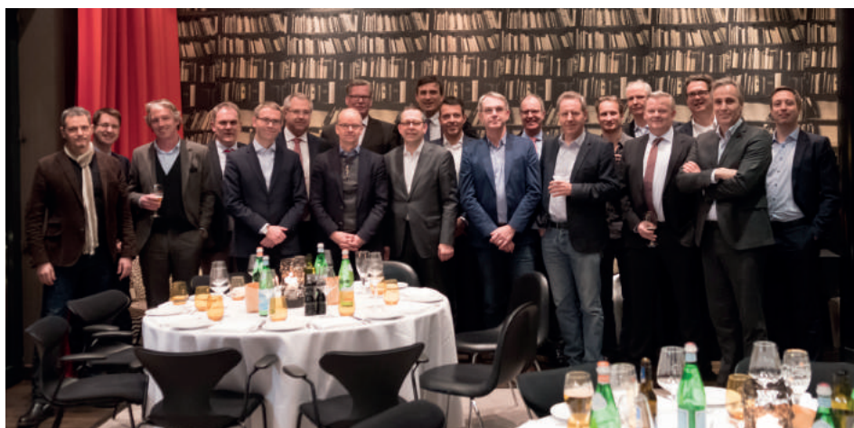
die Gründungsmitglieder des LC Hamburg-Binnenalster