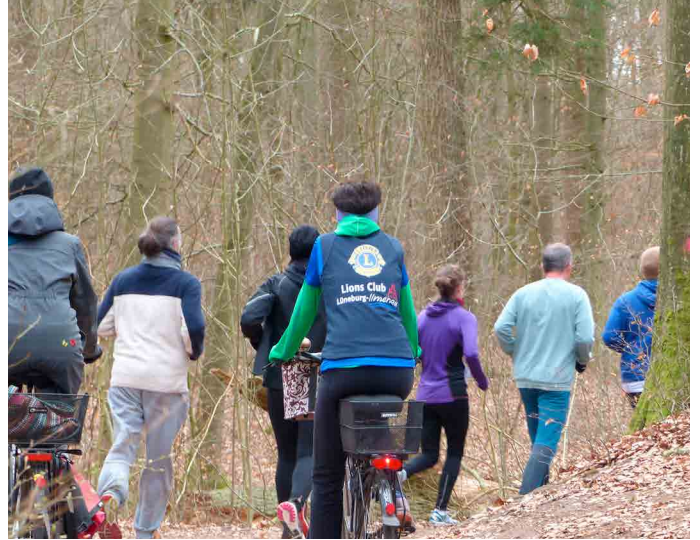
Laufen, Walken, Radeln – jede*r wie er mag

Ganz herzlichen Dank an dieser Stelle an alle, die sich schon angemeldet haben! Unser kleines Orga-Team freut sich sehr über Move-Fotos – gehend, radelnd, mit Kind und Kegel, Osterhasen, Hunden oder wie auch immer. Bitte an Move@lions.de zur Veröffentlichung auf Facebook und Instagram. Let's move – gemeinsam mehr erreichen!