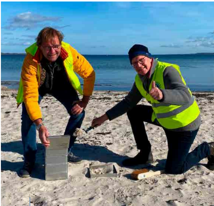
Entnahme von Sandproben an den Ostseestränden

Im Rahmen einer Anfrage des Deep Sea Ecology and Technology, Alfred-Wegener-Institut Helmholtz-Zentrum für Polar- und Meeresforschung an die norddeutschen Lionsclubs, wurde auch an den LC Flensburg von 1959 die Bitte gerichtet, bei der wissenschaftlichen Untersuchung von Mikroplastik an den deutschen Stränden teilzunehmen. Der LC Flensburg von 1959 nahm sich dieser Activity sofort an und hat an zwei Terminen mit mehreren Clubmitgliedern an dieser Aktion teilgenommen, um diese wissenschaftliche Studie zu unterstützen. So wurden an 3 ausgesuchten und sehr beliebten Stränden in und um Flensburg (Solitüde, Holnis, Langballigau) diverse Sandproben nach einem vorgegebenen Schemata gesammelt, um diese dem Alfred-Wegener-Institut Helmholtz-Zentrum für Polar- und Meeresforschung zur weiteren Untersuchung zukommen zu lassen. Wir alle sind auf das Ergebnis dieser Untersuchung an allen Stränden an Nord – und Ostsee gespannt, wie sich die Kontamination mit Mikroplastik an den Küsten schon auswirkt.