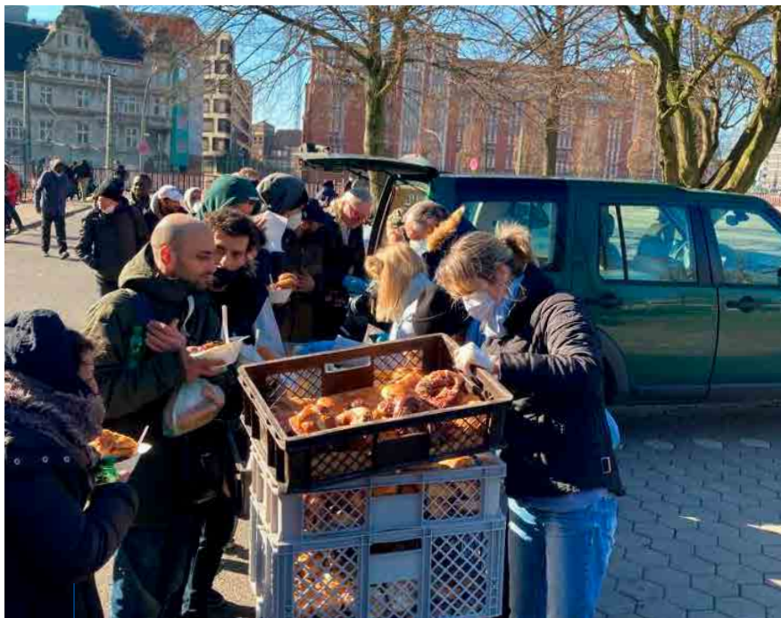
Jeden Sonntagvormittag wird vom Lions Club Hamburg-Victoria Essen an Obdachlose Menschen in Hamburg verteilt.

Wir freuen uns, mit unserer Activity regelmäßig etwas Gutes zu tun für Menschen, denen es nicht so gut geht wie uns. Und handeln damit ganz nach dem Motto der Lions-Clubs „We serve“.