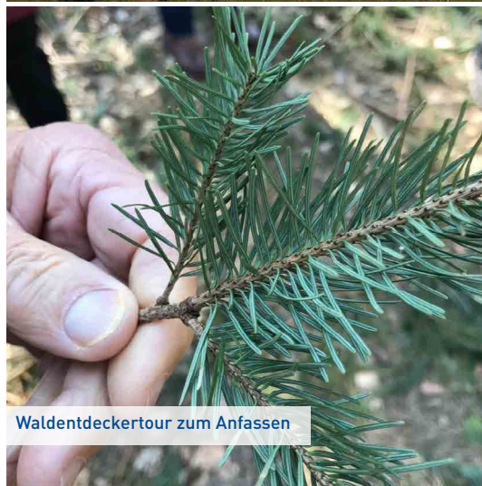
Waldentdeckertour zum Anfassen