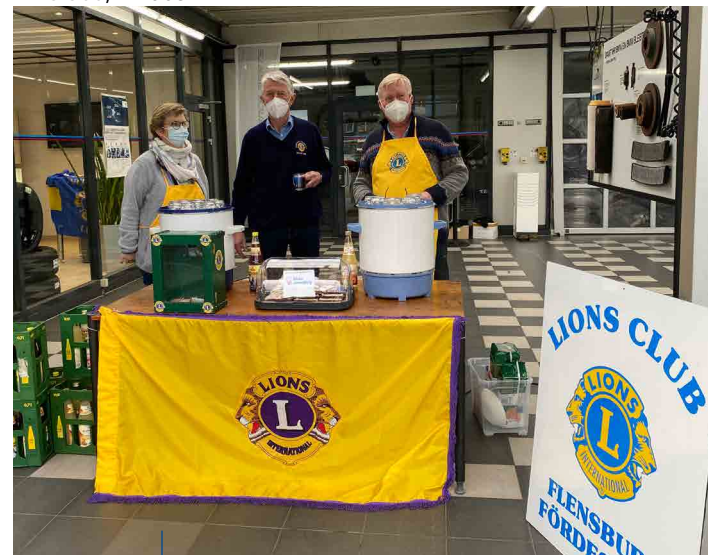
Die Wartezeit bei der Impfkation wurde vom Lions Club Flensburg Fördestadt mit Schmalzbrot und alkoholfreiem Punsch versüßt.

Und dann ging es zur Impfung. Die Impfung wurde durchgeführt von vier Ärzten und vier medizinischen Fachangestellten.