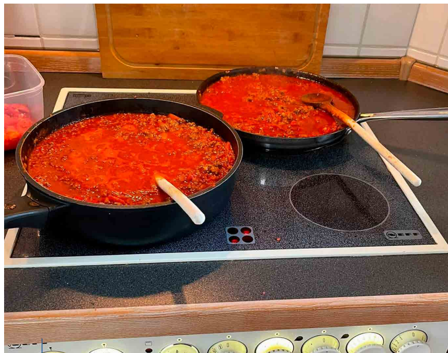
Zubereitung der 90 Portionen Essen Chili con Carne in der heimischen Küche.