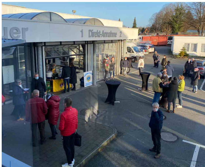
Die Impfkation des Lions Club Flensburg-Fördestadt wurde gut angenommen

Mittlerweile ist das Honorar von der Kassenärztlichen Vereinigung/ Schleswig-Holstein auf das Förderkonto des Lions Club Flensburg-Fördestadt überwiesen worden, und wir werden einen Nettoerlös von ca. 15.500,- € haben.