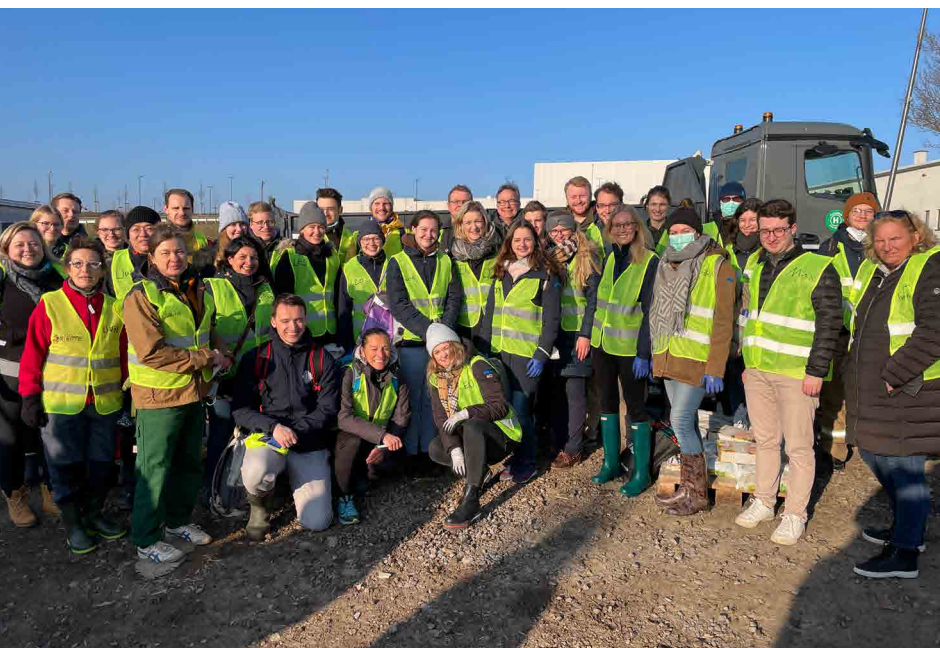
Noch das letzte Gruppenfoto bevor die Arbeit anfängt.