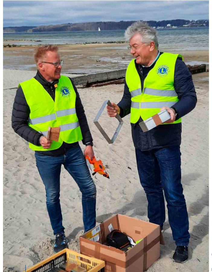
Die letzten Vorbereitungen bevor gleich die ersten Sandproben entnommen werden.