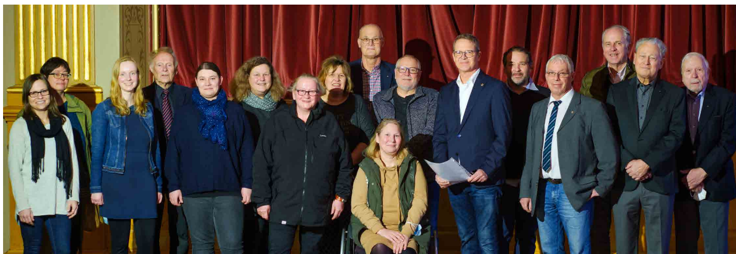
Erlösübergabe durch den Kalenderverkauf in Höhe von 54.000 Euro an neun verschiedene Organisationen im Umkreis von Flensburg

Zu diesem Erfolg des Kalenders haben wieder viele örtliche Unternehmen und Privatpersonen mit Spenden von über 40.000 Euro bei 572 Preisen (Reisegutscheine, Laptops, Flachbildfernseher, Restaurant- und Tankgutscheine etc.) beigetragen. Wie jedes Jahr hält der LC Flensburg von 1959 eine gewisse Summe für Ad Hoc Hilfen zurück, die mit Sicherheit auch in den nächsten Monaten noch dringend gebraucht werden. Schade ist wie jedes Jahr immer wieder, dass fast 20 Prozent des Reinerlöses an Lotteriesteuer abgeführt werden muss. Was könnte man für dieses Geld alles Gutes tun nach dem Motto - we serve-.