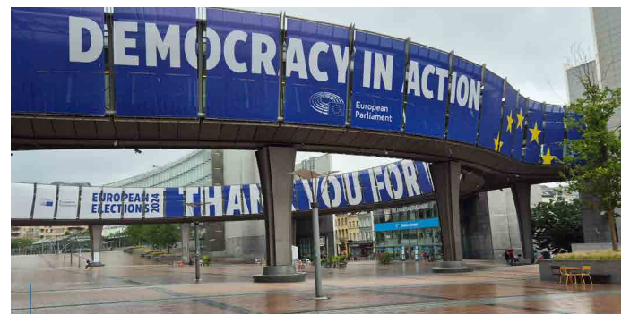
Vorplatz des Europäischen Parlaments: Hier soll der Lauf am 12.10. enden.

Näheres unter https://lionseuropaforum2024.fr/de oder bei Eurer Kabinettsbeauftragten Europa unter brand_annelte@yahoo.de