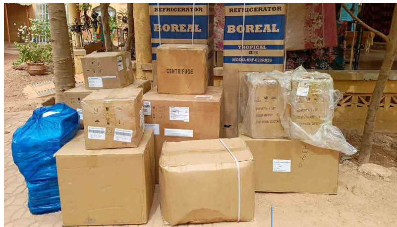
Jetzt geht es ans Auspacken!