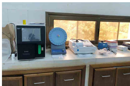
Und sieh da – die ersten Geräte sind schon im Einsatz!