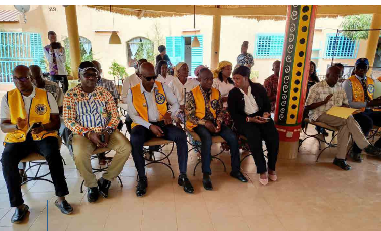
Vertreter des LC Karite in Ouagadougou bei der Einweihung