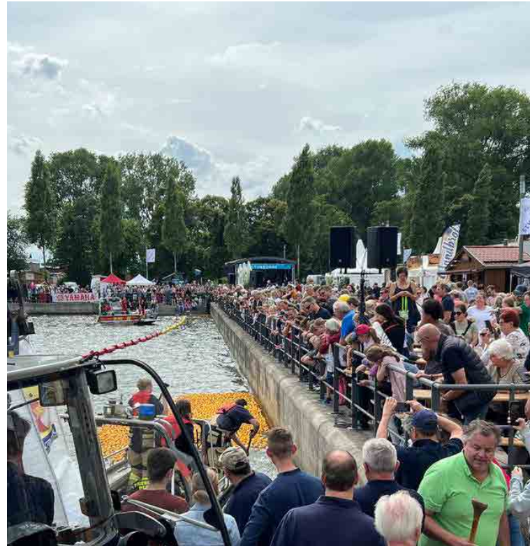
Gedränge beim Sprung ins Wasser

Besonders freut sich der Hamburger Club, dass das Nachhaltigkeitskonzept auf breite Zustimmung trifft. Für 5 Euro Startgebühr gibt es wie bereits im Vorjahr keine gelbe Plastikente in die Hand, sondern einen Patenschein mit der Startnummer der „eigenen“ Ente. Die Enten werden nach dem Rennen aus dem Wasser gefischt und kommen erneut zum Einsatz. Dieser