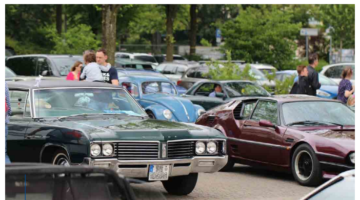
Neben der Oldtimer Ausfahrt fand auch eine Oldtimer Ausstellung statt.