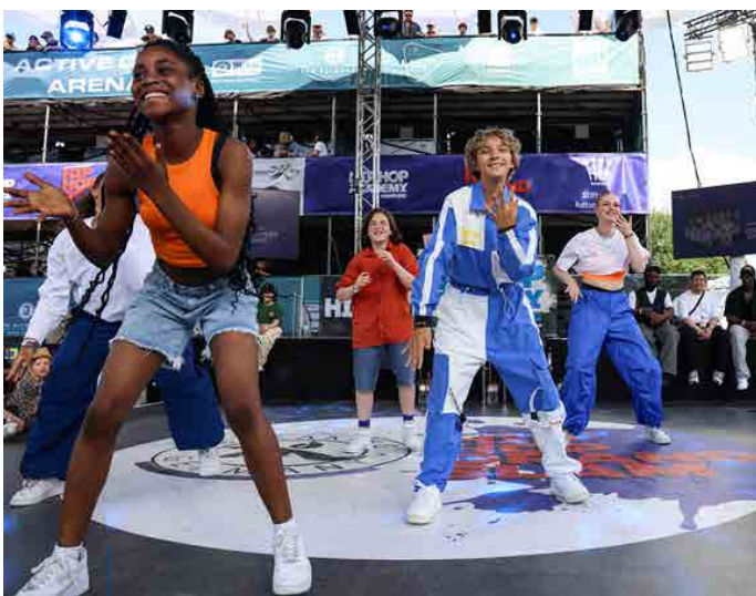
Auftritt der HipHop Academy Hamburg

Die jungen Talente erhalten die Möglichkeit, mit etablierten Künstlern zu arbeiten, an Wettbewerben teilzunehmen und vielleicht einmal auf einer ganz großen Bühne aufzutreten, wie z. B. am Tag der Deutschen Einheit in der Elbphilharmonie. Dadurch entwickeln sie nicht nur ihre Fähigkeiten weiter, sondern knüpfen auch erste Kontakte in der Szene. Das Training und die Auftritte fördern Disziplin, Ausdauer und das Streben nach Exzellenz – Eigenschaften, die den Jugendlichen auch in anderen Lebensbereichen zugutekommen.