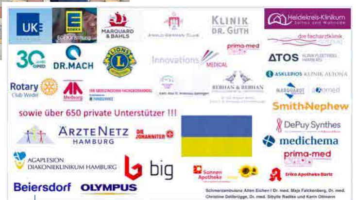
Firmen/Organisationen, die in den letzten 2 Jahren gespendet haben