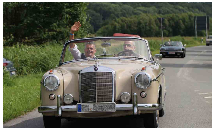
Bei der touristischen Oldtimerausfahrt hat auch ein Mercedes S300 teilgenommen.