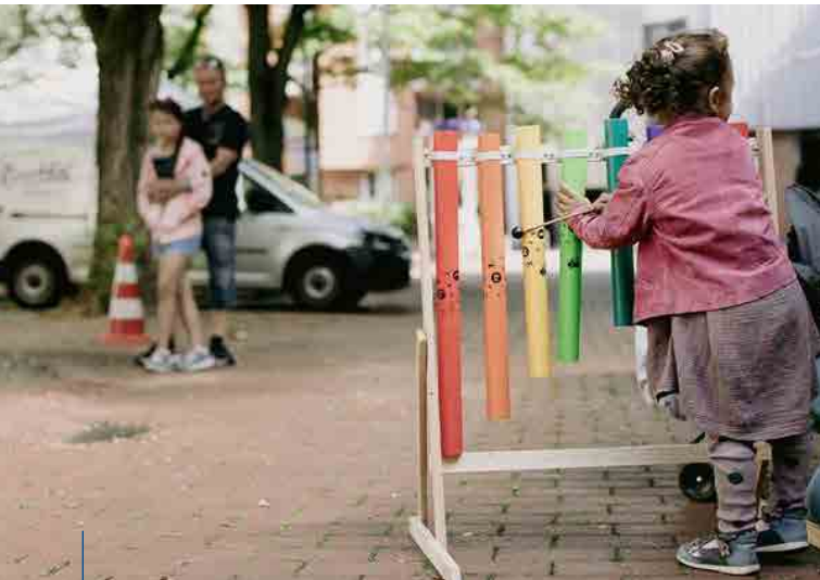
Ausprobieren von Instrumenten auf einer Klangstraße

Beide Projekte – die HipHop Academy und die Klangstrolche – wurden durch die Stiftung der deutschen Lions großzügig unterstützt. Dank dieser Förderung können die Angebote kontinuierlich erhalten und weiterentwickelt werden. Eine solche Partnerschaft sichert nicht nur die Zukunft der Projekte, sondern auch die Zukunft der Kinder und Jugendlichen, die von ihnen profitieren. Ein herzliches Dankeschön dafür!