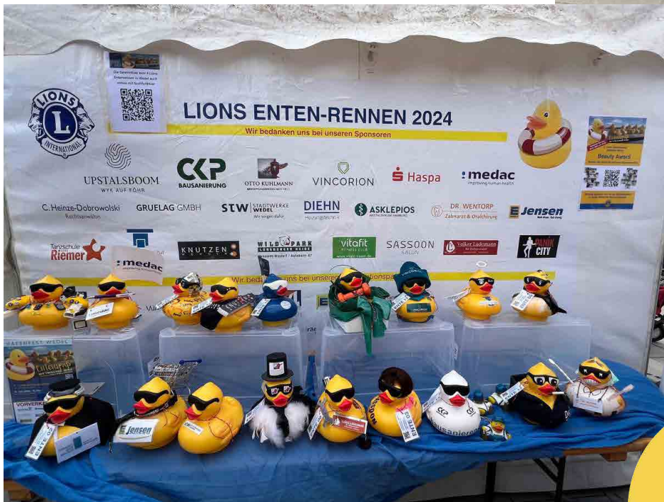
Präsentation der Sponsoren-Enten auf dem Wedeler Hafenfest