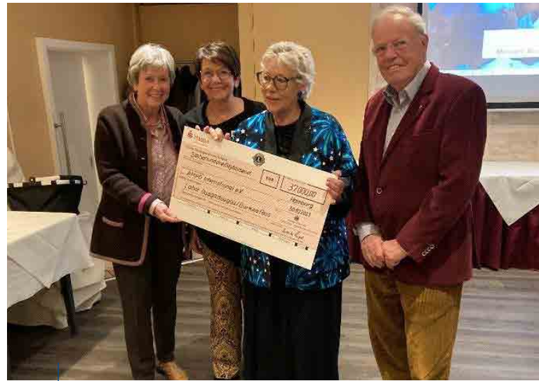
Scheckübergabe durch den LC Hamburg-Altona