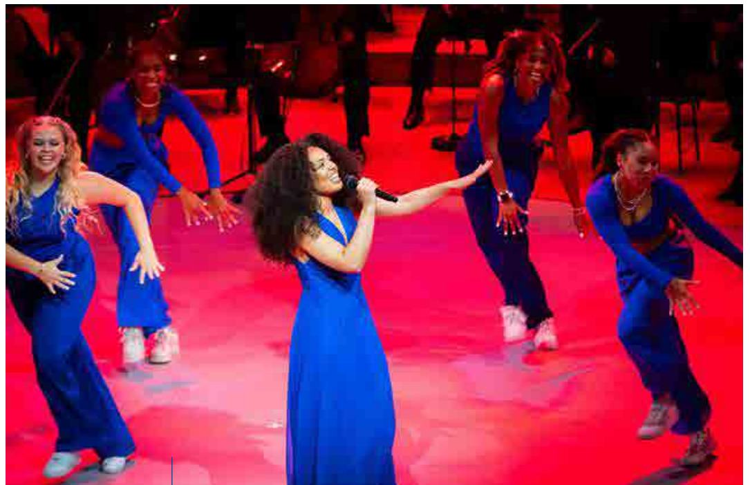
Auftritt in der Elbphilharmonie