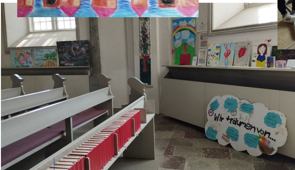
1. Galerie der Bilder der DaZ-Klasse der Gemeinschaftsschule Kappeln in der St. Nikolaikirche.