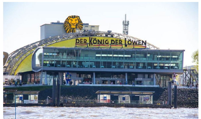
Theater Der König der Löwen in Hamburg.

Und jetzt kommt der Löwe ins Spiel: Im Jahr 2025 soll der Giebel des Theaters „König der Löwen“ erlesen werden. Der ist zwar nicht so hoch wie der Michel oder der Fernsehturm und muss deshalb natürlich mehrfach erlesen werden! Für die fleißigsten Leseklassen gibt es, wie immer, spannende Preise zu gewinnen. Bücher, Lesungen, Events, vielleicht auch mal einen Besuch beim HSV, St. Pauli oder dem König der Löwen?